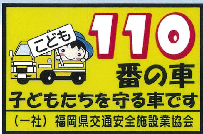
目印のステッカー

当協会は、 YELLOW SAFETY キャンペーンに 賛同し、子どもたちが事故に巻き込まれ ないよう協会では取り組んでいます。