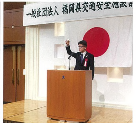
見坂部長(乾杯のご発声)