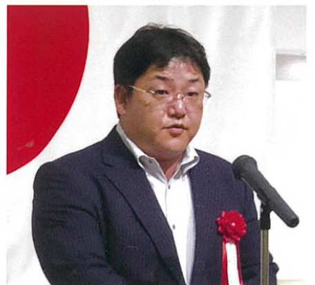
星子副会長(閉会の挨拶)